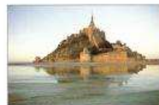
LE MONT SAINT MICHEL

Merci de réserver au plus vite à Charly Boinet : 02 96 28 77 57 ou Pierre Duros 02 96 26 81 61